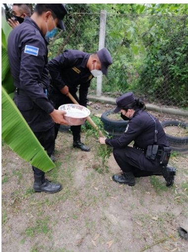
11: Estudiantes del Técnico en Ciencias Policiales.

En el desarrollo de este contexto la IV Promoción por equivalencia inicio su proceso en los meses de enero y febrero 2022. Con la distribución de 105 estudiantes divididos en 11 equipos de trabajo, los cuales investigaron en su sector de patrullaje o incidencia beneficiar a un grupo de personas que requirieran la implementación de un proyecto social a corto plazo. Esto dio pie a desarrollarse los siguientes proyectos realizados :