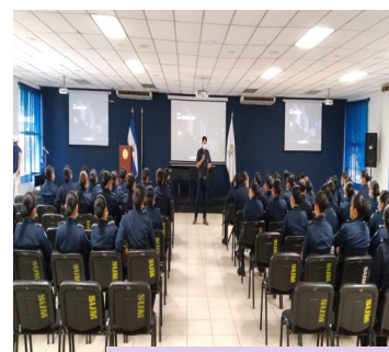
I18: Alumnas de la P-127 en cinefórum, marzo 2022.

En El Salvador, son altos los índices de violencia intrafamiliar, al policía le corresponde mediar ante estas situaciones partiendo de las denuncias de los ciudadanos que sufran esas decisiones, las mujeres de la promoción 127 deberán ser ejemplares en el combate a este flagelo diciendo un basta ya a la violencia de género.