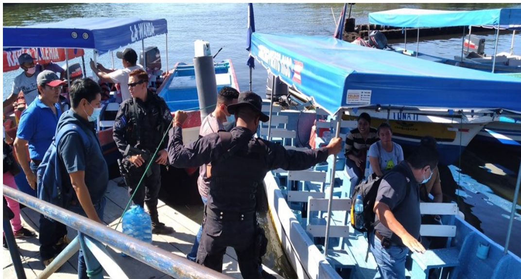
I13: Estudiantes del Tecnólogo en Ciencias Policiales, La Paz.

tivo del caserío Quislua, La Herradura, departamento de La Paz; solo llegar al lugar es una aventura, los compañeros que realizaron la primera supervisión debieron transportarse en lanchas y encontraron que el mencionado centro escolar tiene múltiples necesidades.