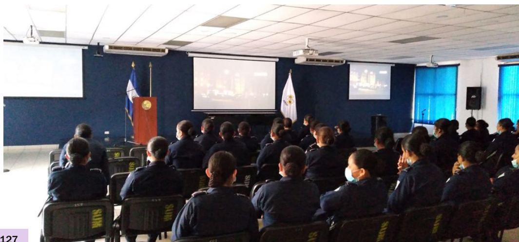
I16 Alumnas de la P-127 en cinefórum, marzo 2022.

“El día 8 de marzo se conmemora el día Internacional de la mujer, en El Salvador”.