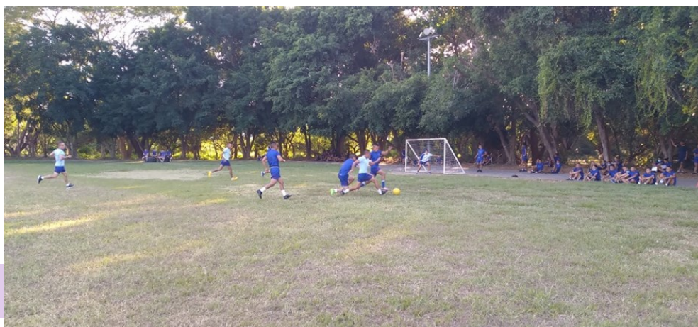
I20 Estudiantes, equipo masculino, P- 127.

mano de cara a las necesidades educativas actuales. Todas las actividades, ya sea de carácter social, deportiva, recreativa y cultural; se aprovecha el tiempo disponible de las diferentes promociones.