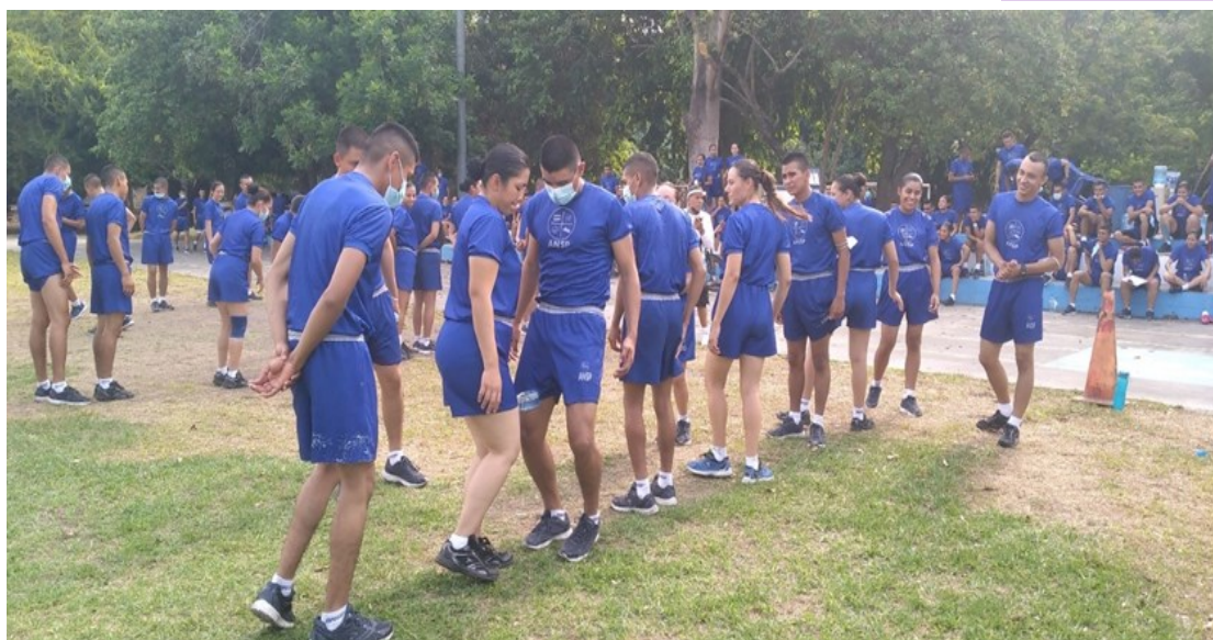
I24: Estudiantes en el juego de pasar la botella, P- 128.