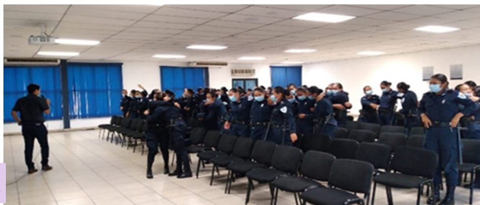
I19: Alumnas de la P-127 en cinefórum, marzo 2022.

“las mujeres debemos caminar con certeza de que somos capaces de salir adelante por nuestros propios medios”.