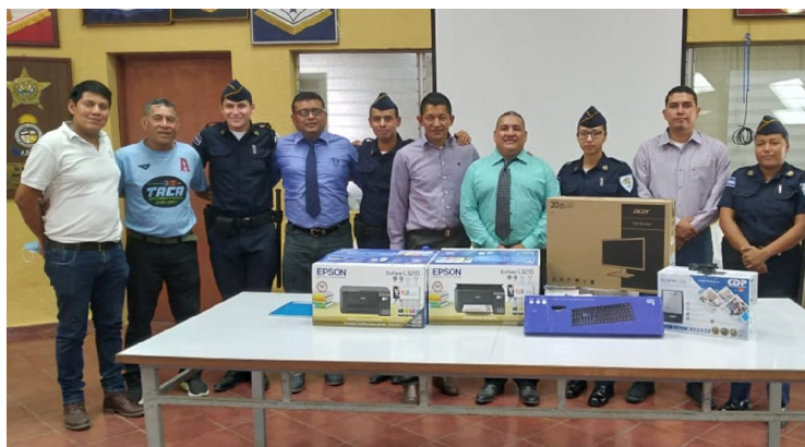
17: Estudiantes del Técnico en Ciencias Policiales, La Paz.