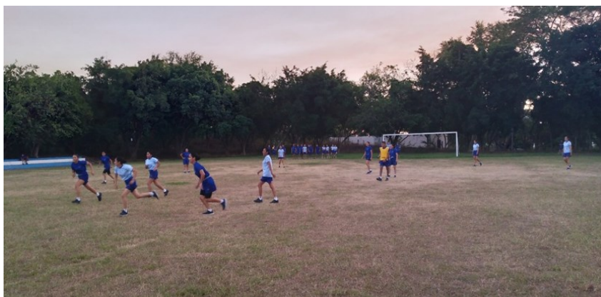
I21: Estudiantes, equipo femenino, P- 127.

El año 2022, inició con el torneo de fútbol, para los estudiantes de las promociones 127 y 128 del nivel básico, en las categorías masculino y femenino, inaugurado el 18 de enero.