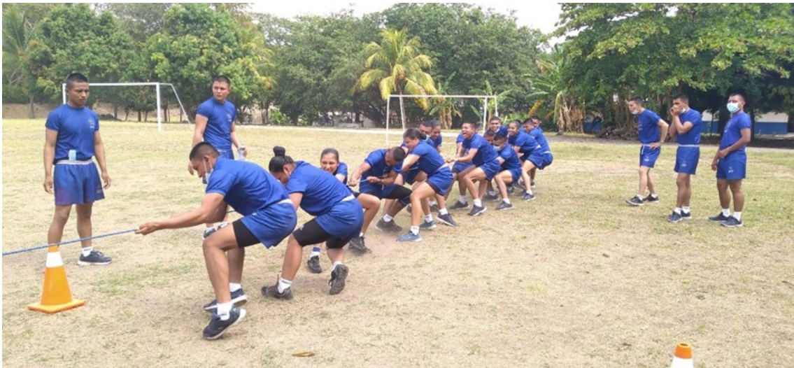
I28: Estudiantes en el juego de halar el lazo, P- 128.

a la gran final el primero y segundo lugar respectivamente, si existiere empate se definirá por el que tenga mejor tiempo.