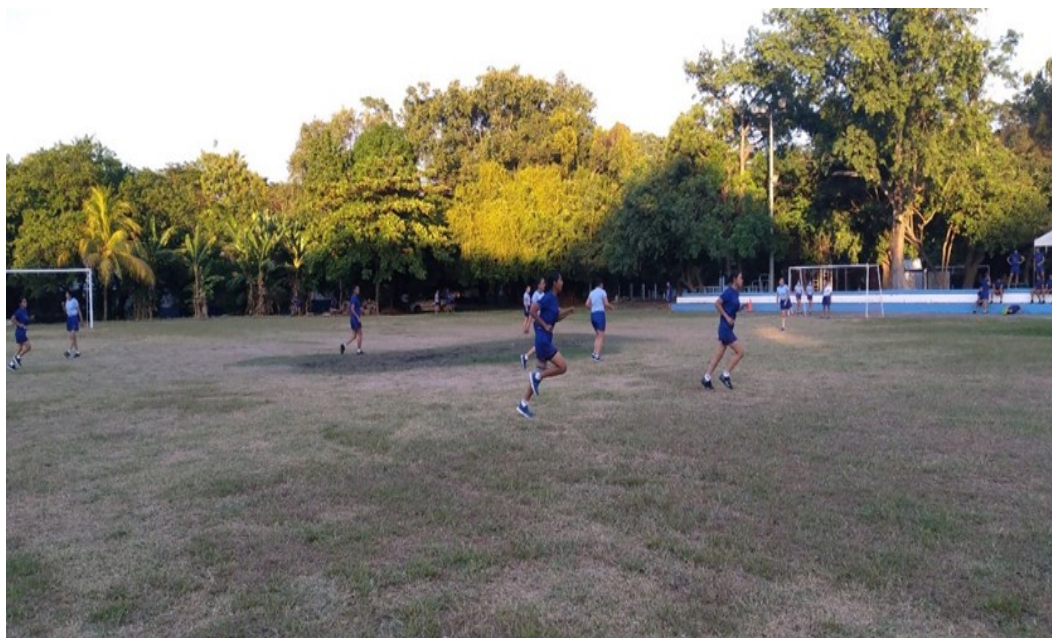
I22: Estudiantes, equipo femenino, P- 128.

y cinco equipos en la categoría femenina, el personal de estudiantes beneficiado de la promoción 128 son 220, los juegos se realizan los días martes y jueves en horario de 16:00 a 18:00 horas, el torneo de la promoción 128 está programado para finalizar en el mes de junio.