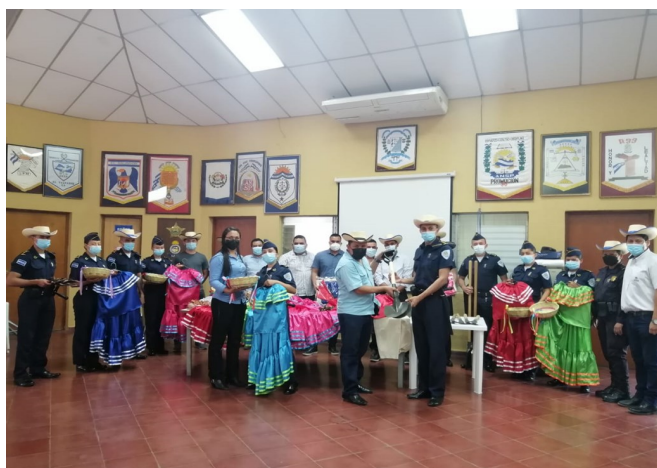
I9: Estudiantes del Técnico en Ciencias Policiales, La Paz.