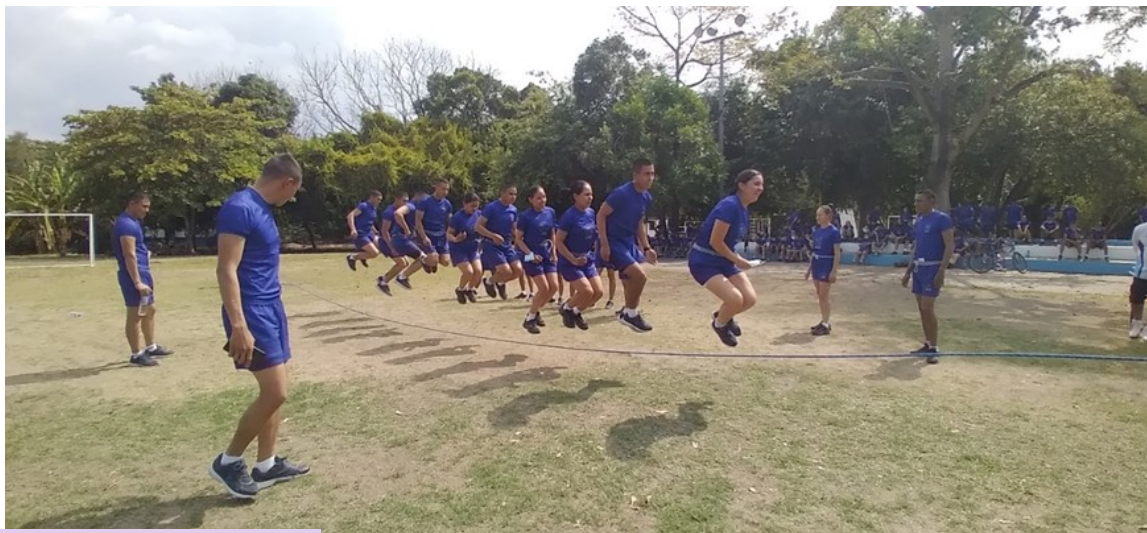
I25: Estudiantes en el juego de saltar la cuerda, P- 128.

la mayor cantidad de integrantes en cada salto. Tendrán que realizar como mínimo 5 saltos como requisito para contar el número de participantes saltando.