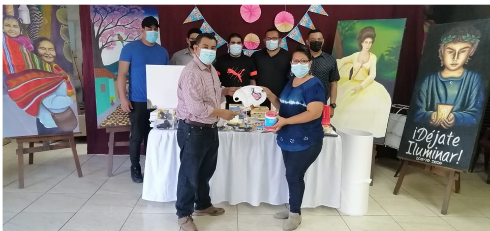
111: Estudiantes del Técnico en Ciencias Policiales, La Paz.