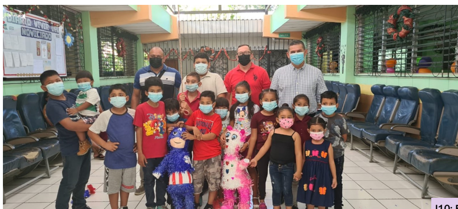
110: Estudiantes del Técnico en Ciencias Policiales, La Paz.