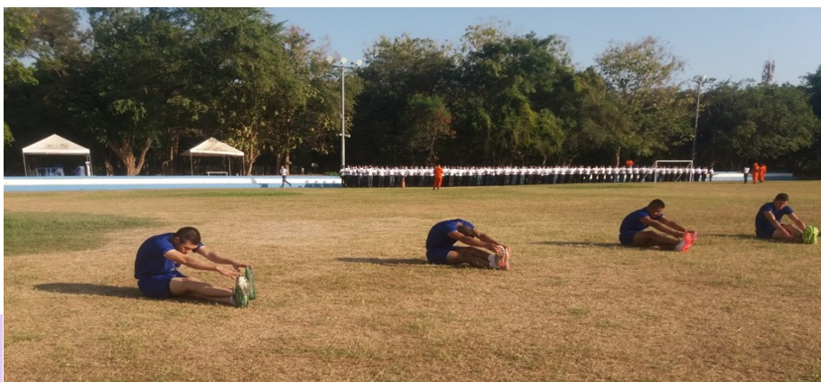
I28: Selección masculina de futbol, Promoción, 127.

ferentes disciplinas deportivas como, futbol 11 masculino, futbol sala y futbol 9 femenino, atletismo (velocidad, fondo, medio fondo, lanzamiento de bala, lanzamiento de jabalina y relevos), tenis de mesa, ajedrez y natación.