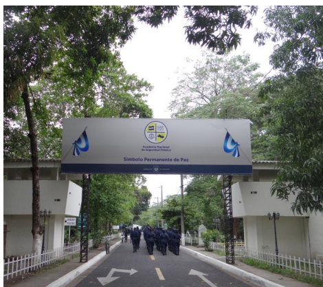
ANSP, sede San Luis Talpa.

En este primer número se presentan las actividades estudiantiles realizadas en el primer trimestre 2022, tales como: el cine fórum, proyectos de servicios social, jornadas deportivas; se presenta también, la actividad académica que se está desarrollando y una reseña bibliográfica; cuenta en el espacio para el talento humano de la institución; humor y curiosidades; y finalmente, un juego retador interesante.