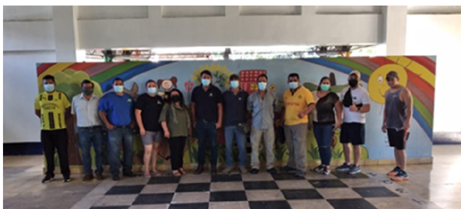
I6: Estudiantes del Técnico en Ciencias Policiales, La Libertad.