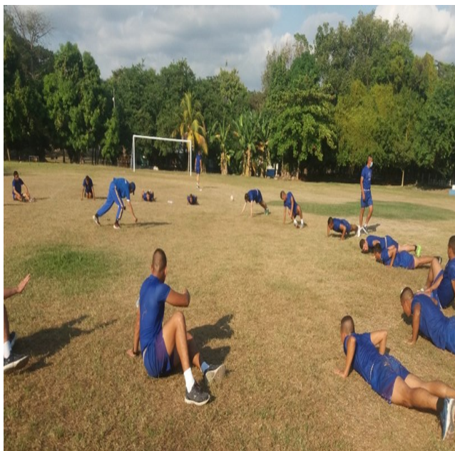
I28: Selección masculina de futbol, P-127.

La Academia Nacional de Seguridad Pública, forma parte desde el año 2017, de la Asociación Nacional Deportiva de Educación Superior (ANADES), la cual está integrada por los centros de estudios superiores más importantes de nuestro país. Hemos participado en di-