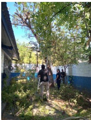
I14: Estudiantes del Tecnólogo en Ciencias Policiales, La Unión.

Las imágenes indican el enorme esfuerzo que los estudiantes realizan en pro de ayudar a otros salvadoreños en condiciones de vulnerabilidad.