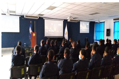
I17: Alumnas de la P-127 en cinefórum, marzo 2022.

“La película enfoca diferentes tipos de violencia intrafamiliar”.