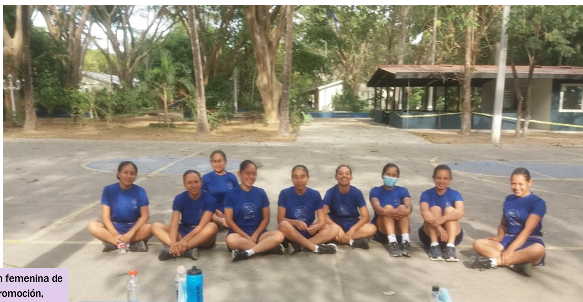
I29: Selección femenina de fútbol sala, Promoción, 127.

días lunes y miércoles en horario de 16:00 a 18:00 horas y martes y jueves en el mismo horario siempre y cuando no exista programación de juegos de torneos internos con los estudiantes. Como se muestra en las siguientes láminas.