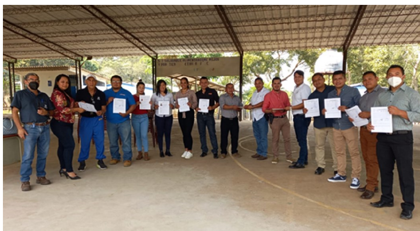
I2: Estudiantes del Técnico en Ciencias Policiales, Ahuachapán.