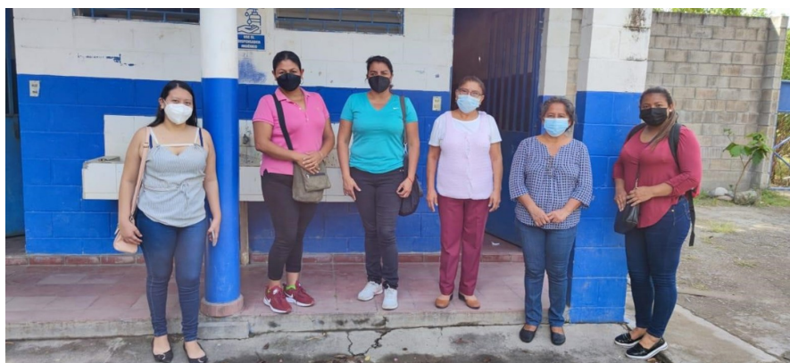
18: Estudiantes del Técnico en Ciencias Policiales, La Paz.