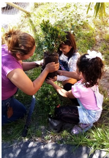
I12: Estudiantes del Técnico en Ciencias Policiales, La Paz.