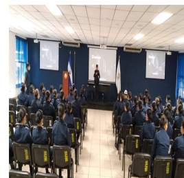
I15: Alumnas de la P-127 en cinefórum, marzo 2022.

Síntesis de la película: «Te doy mis ojos cuenta la historia de Pilar y Antonio; pero también de quienes los rodean, una madre que consiente, una hermana que no entiende, un hijo que mira y calla, unas amigas, una sociedad y una ciudad como Toledo que añade con su esplendor artístico y su peso histórico y religioso una dimensión más a esta historia de amor, de miedo, de control y de poder».