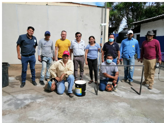
I3: Estudiantes del Técnico en Ciencias Policiales, Sonsonate.