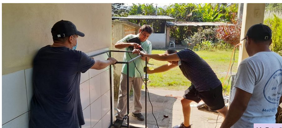
I4: Estudiantes del Técnico en Ciencias Policiales, Sonsonate.